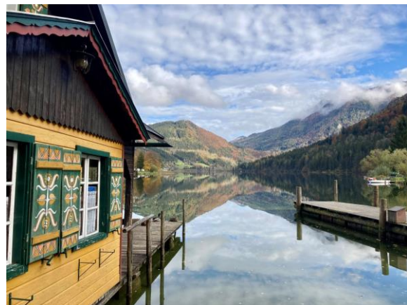
bei der Bootsvermietung